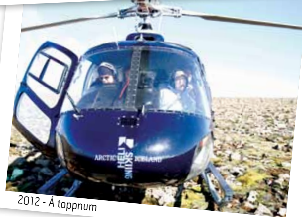
2012 - Á toppnum