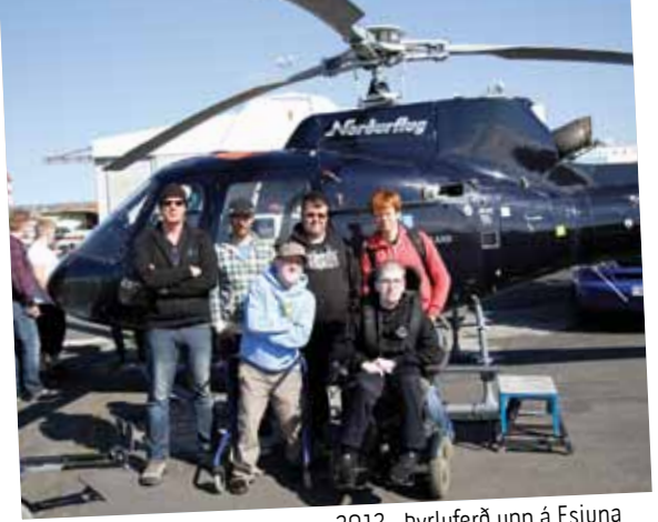
2012 - Þyluferð upp á Esjuna

Við gerðum margt annað í sumar eins og kennslumyndbönd fyrir ýmis hjálpartæki sem koma á