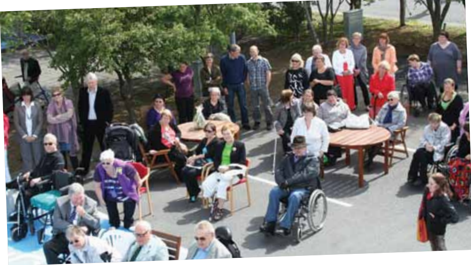
Opnun Þekkingarmiðstöðvarinnar fór fram utandyra í góðu veðri og var mikill fjöldi gesta viðstaddur.