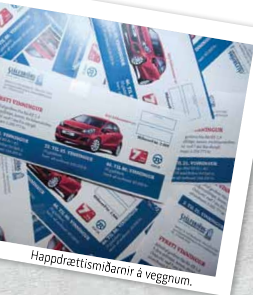
Happdrættismiðarnir á veggnum.