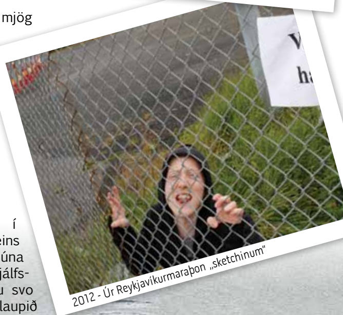
2012 - Úr Reykjavíkurmaraþon „sketchinum“